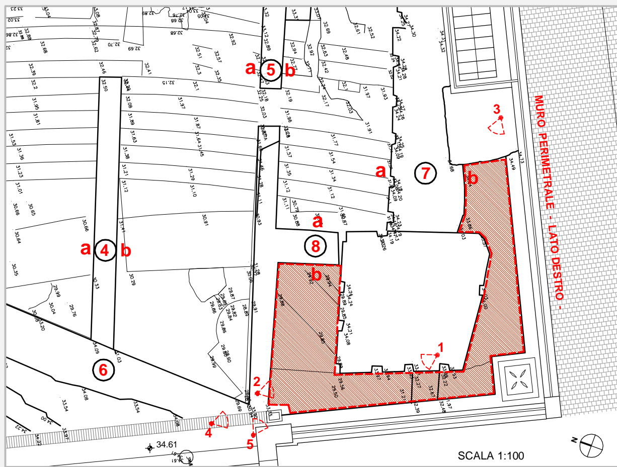
AREA IN ESAME 5 NUMERAZIONE SETTI MURARI DETTAGLIO PIANTA QUOTA 37,32