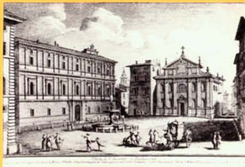
G. Vasi, Veduta di Piazza Scossacavalli metà XVIII sec.

La struttura della fontana riprende lo schema tradizionale tardocinquecentesco con vasca a pianta mistilinea risultante dall'inserimento di archi di cerchio in un quadrato. Al centro della vasca un balaustro, con gli emblemi araldici Borghese (due draghi e due aquile), sorregge un catino circolare.