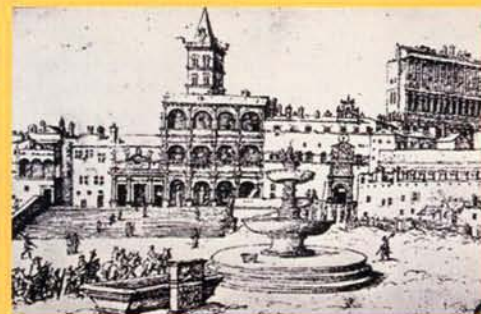
Heemskerck, fontana innocenziana, 1533 circa

La fontana più antica, quella di destra, composta da due catini sovrapposti, fu costruita nel 1490 durante il pontificato di Innocenzo VIII (1484-1492), in una posizione diversa dall'attuale. Nel 1501, sotto papa Alessandro VI Borgia (1492-1503), venne restaurata dall'architetto Alberto di Piacenza che aggiunse un altro catino di marmo da cui si affacciavano quattro teste di bue (simbolo araldico del Papa), rimosse dopo la morte del pontefice. Nel febbraio 1614 papa Paolo V decise di ripristinarla affidandone la direzione a Carlo Maderno che demolì la vecchia fontana innocenziana. Benché non si discostasse molto dall'originaria, la nuova fontana presentava caratteristiche singolari come il catino sovrapposto rovesciato dal quale si innalzavano più zampilli che ricascano increstandosi sulla superficie embricata. La fontana rimase in posizione asimmetrica rispetto alla facciata della basilica e all'obelisco fino a quando con Alessandro VII (1655-1667) non fu costruito il colonnato su progetto di G.L. Bernini che edificò la fontana di sinistra sul modello di quella del Maderno e spostò quest'ultima in asse con l'obelisco e con la fontana nuova.