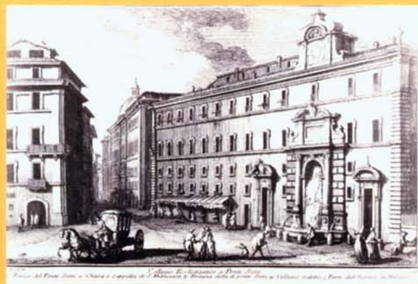
G. Vasi, Veduta del Collegio Ecclesiastico a Ponte Sisto, seconda metà del XVIII sec.

La grande fontana fu costruita nel 1613 dal fiammingo Jan van Santen, noto in Italia come Giovanni Vasanzio (1550-1621), in collaborazione con Giovanni Fontana. Voluta da papa Paolo V Borghese, si trovava in origine sulla riva sinistra del Tevere a ridosso dell' "Ospizio dei Mendicanti", detto anche dei "Cento Preti" come fondale di via Giulia in corrispondenza di Ponte Sisto. La fontana fu smontata nel 1879, in seguito alla realizzazione degli argini del Tevere, che comportarono la distruzione dello stesso Ospizio. Nel 1898 fu ricostruita sulla sponda destra del fiume, sempre in asse con il ponte. L'ubicazione della fontana ai piedi del Gianicolo, sovrastato dall'imponente mostra dell'Acqua Paola, offre una spettacolare soluzione prospettica che permette la percezione unitaria delle due fontane.