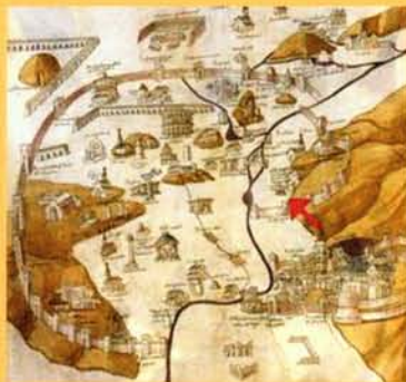
Pianta di Roma, Pietro del Massaio, 1471

Documentata per la prima volta nel 1471 nella pianta di Roma di Pietro del Massaio (Biblioteca Apostolica Vaticana, Codice Urbinato Latino 277, f. 1312), presentava una vasca poligonale, al centro della quale s'innalzavano due catini di diversa grandezza. Questa forma, con alcune varianti, sarà mantenuta fino ai nostri giorni, nonostante la fontana sia stata oggetto di molteplici interventi tra cui quello di Girolamo Rainaldi (1570-1655) nel 1604, probabilmente in concomitanza con l'arrivo in Trastevere dell'acqua Felice, . All'epoca di papa Alessandro VII Chigi (1655-1667) la fontana venne spostata al centro della piazza e venne dotata di una maggiore quantità d'acqua proveniente dal rinnovato acquedotto Paolo. I lavori furono affidati a Gian Lorenzo Bernini (1598-1680) che intervenne sulla vasca ottagonata aggiungendo quattro conchiglie. Nel 1692 l'architetto Carlo Fontana (1634/38-1714), su commissione di Innocenzo XII Pignatelli (1691-1700), ampliò la capacità della vasca e sostituì le conchiglie berniniane con altre più grandi a valva eretta. Nel 1873 il Comune di Roma ricostruì la fontana fedelmente secondo il modello del 1692 utilizzando il bardiglio grigio e aggiungendo una vistosa iscrizione S.P.Q.R all'esterno delle conchiglie.